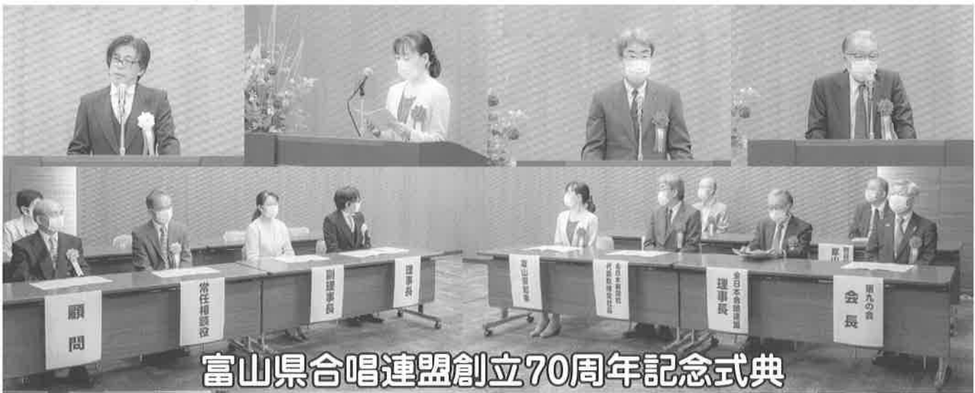
富山県合唱連盟創立70周年記念式典

終わりに、創立70周年にあたり、多大なご支援をいただきました北日本新聞社、富山県、富山市、富山県芸術文化協会、全日本合唱連盟ほか関係の皆様にご心より感謝申し上げます。