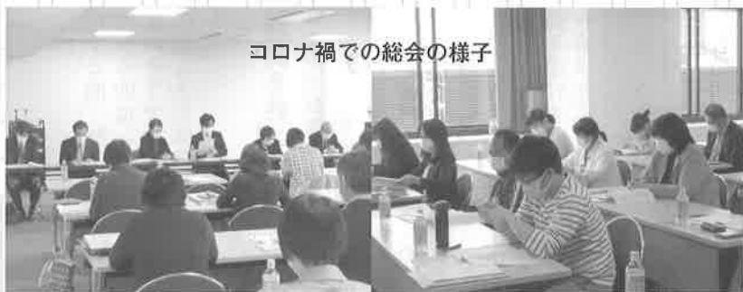
コロナ禍での総会の様子

東京五輪2020の開催が一年延期となりました。私事ですが、延期にならないければ昨年は、アスリートたちの活躍をスタジアムで観戦するはずでした。残念ながら今年はテレビの前での応援となりました。そして、五輪開催延期の原因となった新型コロナウイルスの感染は衰えを見せず、また、自然災害も毎年のように日本列島を襲い、甚大な被害をもたらしています。私たちに与えられた試練の時なのでしょう。今こそ日本人の、我々の底力を一つに。と、祈らずにはいられません。県連も令和二年度がスタートしました。感染予防対策をして演奏会を開催する合唱団も徐々に増えてきました。広報部ではフレッシュなメンバーを迎え、皆様の合唱に懸ける熱い想い、感動をお届けできればと思っています。皆様のご意見をお待ちしています。今年度もご協力の程よろしくお願ひいたします。